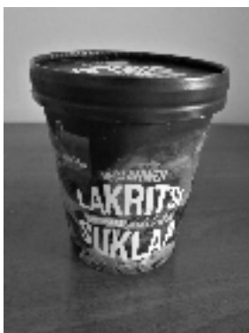
RAINBOW VEGAANINEN LAKRITSI-SUKLAA LUOMUJÄÄTELÖ

Viimeisen parin vuoden aikana vegaanisten jäätelöiden tarjonta kaupoissa on monen muun maitoa korvaavan kasvipohjaisen tuotteen tapaan kasvanut räjähdysmäisesti, ja uutuuksia tulee alati lisää. Kolmesta SavOlaisesta koostuva raati aloitti jäätelökesän huhtikuun puolivälissä testaamalla neljää vegaanista pakasteherkkua.