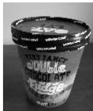
OATLY VERY FANCY DOUBLE CHOCOLATE FUDGE